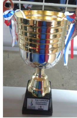
Copa a los Equipos Campeones