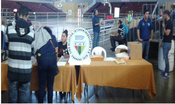
Mesa de llegada de invitados